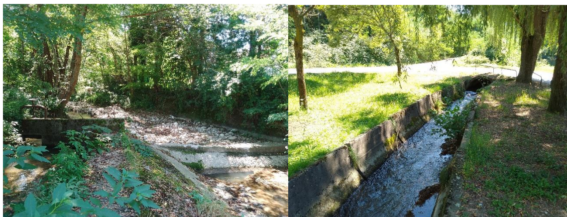
Слика 4 и 5. Устава и јаз