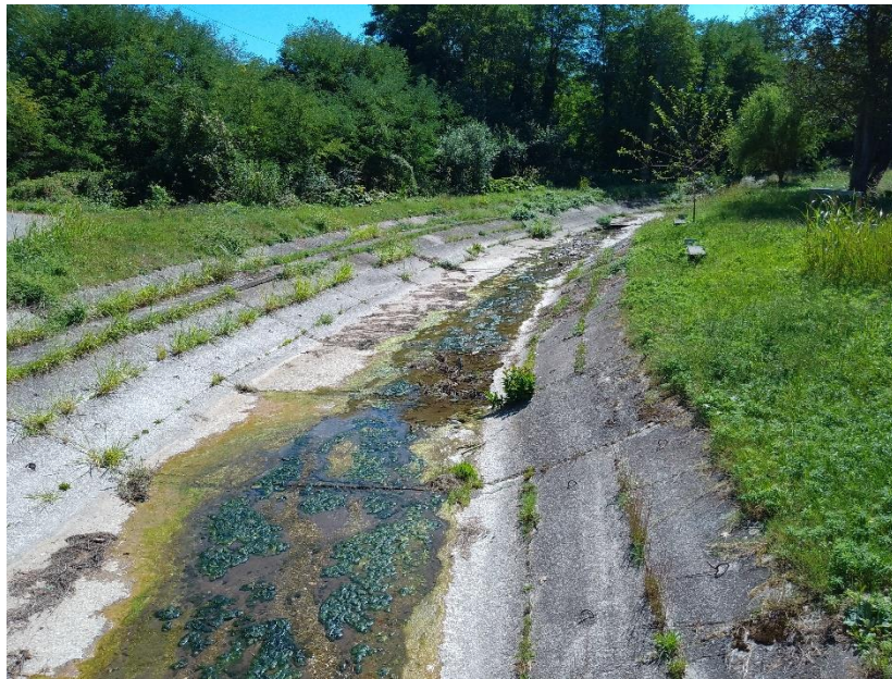
Слика 1. Регулација реке Раче

После учесталих поплава последњих година, поготово у јуну 2023. регулација је претрпела видна оштећења, на неким местима дно регулације је однела велика вода. Устава за усмеравање воде у јаз је услед доспевања великих количина наноса запуњена, што јој отежава нормалан рад.